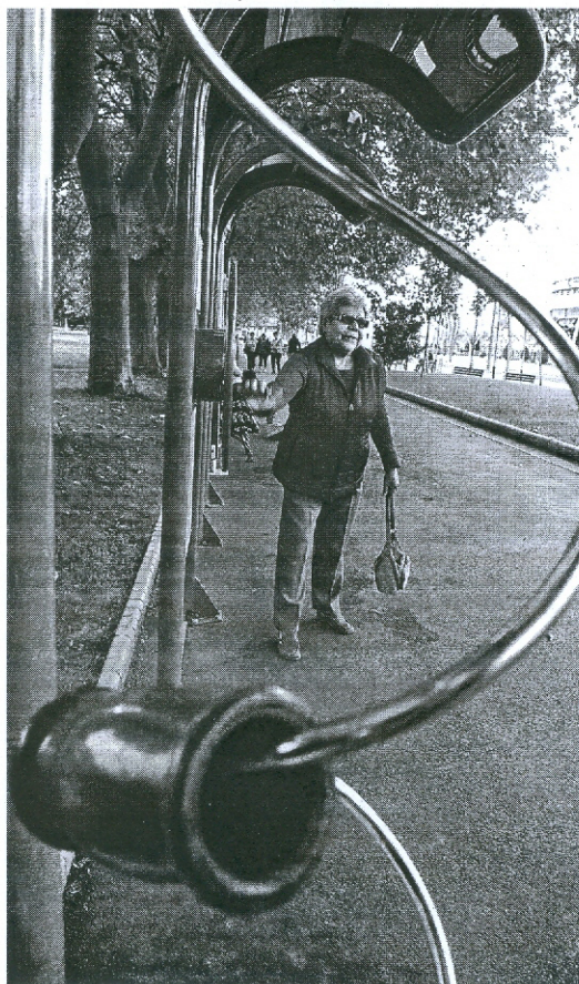
Los mayores ejercitan caderas y articulaciones.

No es de extrañar que cuando el clima es propicio todos quieran disfrutar de su rato de ocio. Los fines